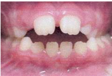
prima della terapia logopedica

Le foto sottostanti mostrano i risultati prima e dopo la terapia per i vizi orali!